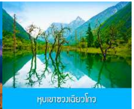
หุบเขาชวงเฉียวโกว