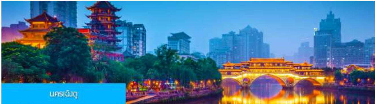
นครเฉิงตู