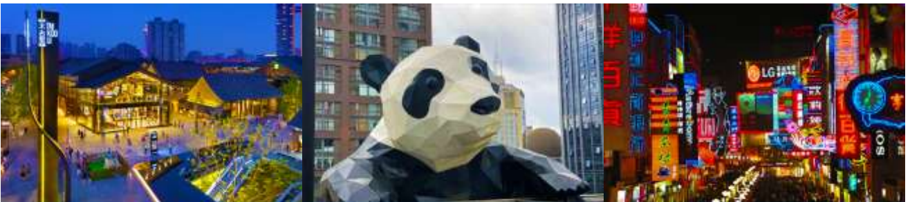
ถนนไท่กู่หลี่ และวัดต้าฉือ