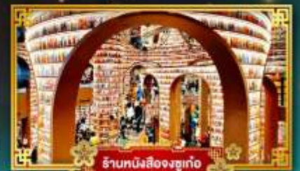
ร้านหนังสือจขงชว่ก้อ