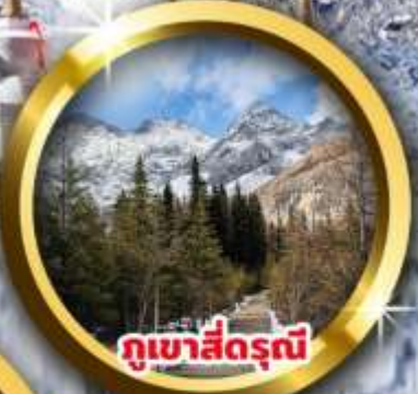
กุเขาสีดรุณี