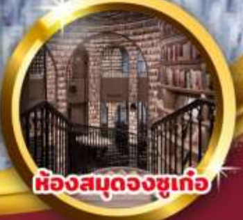
ห้องสมุดจงซูเก่อ