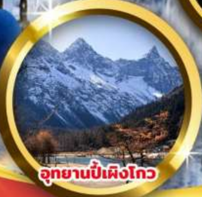
อุทยานปี้เผิงโกว