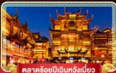
ตลาดร้อยปีเงินหวังเหมียว

เที่ยวมหานครสุดทันสมัย "เซี่ยงไฮ้" ถ่ายรูปเช็คอินที่เก๋ที่สุดปิง เมืองจีนฟิลยุโรป