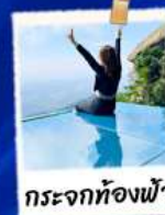
กระจกห้องฟ้า