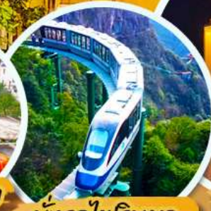
นั่งรถไฟริมพ