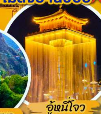
อุ้งน้ใจ

เมนูพิเศษ !! อิ่มอร่อยกับบุฟเฟ่ต์ชาบู และ ปิ้งย่าง พร้อมเครื่องดื่ม