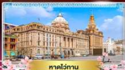
หาดไถ่กาน