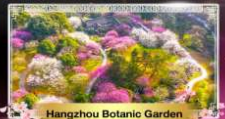
Hangzhou Botanic Garden