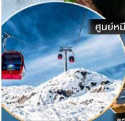
ต้ากู่การ์เซียร์