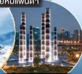
แสดงไฟน้ำพุ SKP