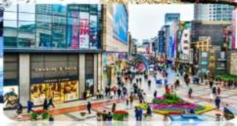
ถนนคนเดินชุนซีถู่