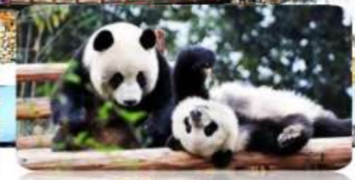
ศูนย์วิจัยหมีแพนด้า

เมนูพิเศษ สุกี้หม่าล่า บฟเฟ่ต์ / เปิดชกกึ่ง 6 วัน 5 คืน เดินทาง : ม.ค. - มี.ย. 68