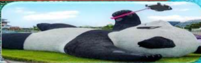
แพนต้าเซลฟี