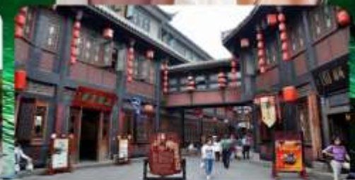
ถนนโบราณเจิ้งหลี่

เมนูพิเศษ สุกี้เห็ด สุกี้เห็ด สุกี้ยำล่า ซาบูไม้อัน 6 วัน 5 คืน เดินทาง : เทศกาลสงกรานต์