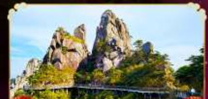
เจาซานซิงซาน