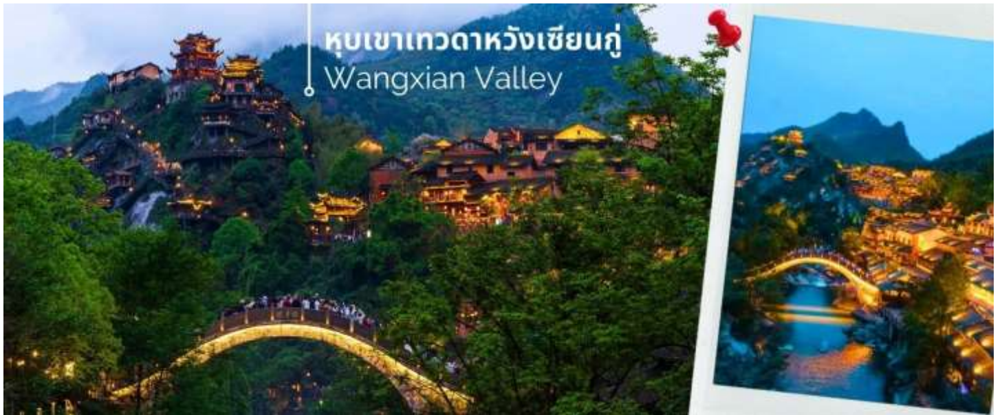
หุบเขาเกวตาทวังเซียนกู่ Wangxian Valley