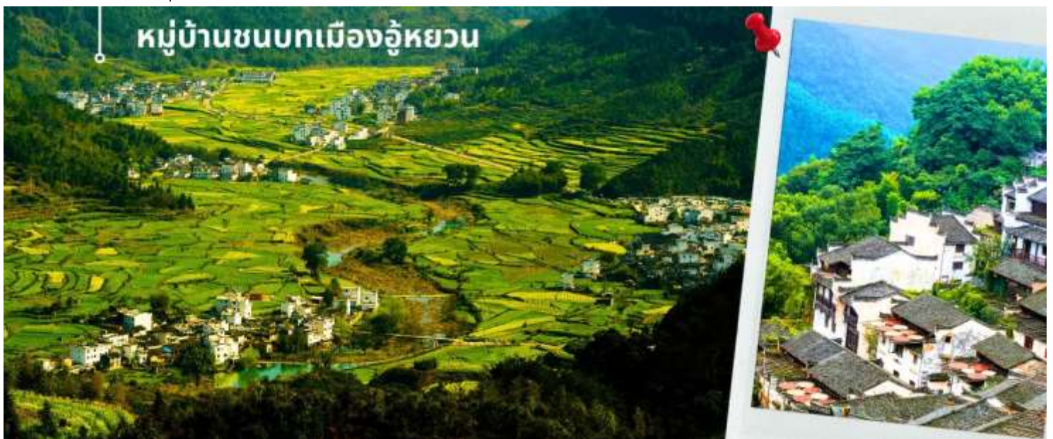
หมู่บ้านชนบทเมืองอู๋หยวน

นำท่านเดินทางสู่ หมู่บ้านชนบทเมืองอู๋หยวน ใช้เวลาเดินทางประมาณ 1.30 ชั่วโมง “เมืองชนบท ที่งดงามที่สุดของประเทศจีน” เป็นเมืองที่ธรรมชาติกลมกลืนกับวิถีชาวบ้านที่เป็นอยู่อย่างเรียบง่ายได้อย่างลงตัว บ้านเก่าแก่ที่อนุรักษ์ไว้อย่างดี สีสันความงามจากธรรมชาติหมุนเวียนไปตามฤดูกาล ทำให้นักท่องเที่ยวได้สัมผัสบรรยากาศที่แตกต่างกันออกไป ตามแต่ฤดูที่มาเยือนเมืองอู๋หยวนแห่งนี้ ซึ่งชาวบ้านยังคงใช้ชีวิตอย่างเรียบง่าย ใช้ชีวิตสบายๆ ริมสายน้ำ ในพื้นที่สีเขียวที่โอบล้อมด้วยภูเขาด้วยความห่างไกลเมือง และข้อจำกัดเรื่องการเดินทางเข้าถึงในสมัยก่อน ช่วยปกป้องให้อู๋หยวนยังคงรักษาธรรมชาติและวิถีชีวิตแบบดั้งเดิมไว้ได้ แม้ว่าปัจจุบันการเดินทางมาที่อู๋หยวนจะสะดวกสบายขึ้นมาก และการพัฒนามาก็เข้าถึงทุกหมู่บ้าน แต่โชคดีที่ผู้คนได้เรียนรู้แล้วว่า พวกเขาโหยหาและยังต้องการให้มีหมู่บ้านที่มีบรรยากาศแบบนี้ต่อไป ดังนั้น อู๋หยวนจึงยังคงความบริสุทธิ์อยู่ได้ ภายใต้กระแสการพัฒนาสมัยใหม่ของจีน