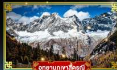
อุทยานภูเขาสี่ครุณี