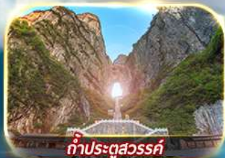
ท่าประตูลั่ว