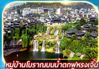
หมู่บ้านโบราณบนน้ำตกฟุรงเจิน