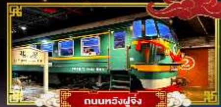
ถนนทวิงฟูจิ่ง