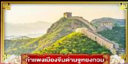
กำแพงเมืองจีนด่านชูหยงกวน

“ตะลุยสวนสนุกยูนิเวอแซล” ชมสิ่งมหัศจรรย์ของโลกกำแพงเมืองจีน