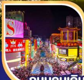
ถนนคนเดิน หวงซิงลู่