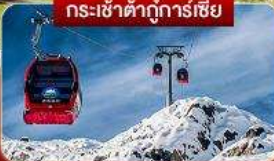
กระเช้าตึกูการ์เซีย