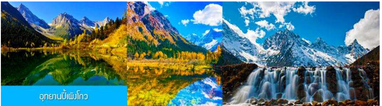
อุทยานปีเพ็งโกว