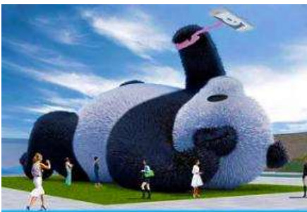
ตุ๊กตาแพนด้าอนเชลฟี

ระหว่างเดินทางท่านสามารถชมทัศนียภาพธรรมชาติอันงดงามของสองข้างถนนขณะที่รถแล่นผ่าน ที่มีทั้งภูเขาหิมะสูง หุบเขา ธารน้ำ และทุ่งหญ้าบนที่ราบสูง หรือพักผ่อนตามอัธยาศัยบนรถระหว่างเดินทาง