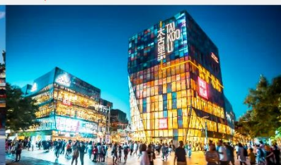
ย่านซุนหลี่ถุ่น

*ทางบริษัทฯ ขอสงวนสิทธิ์ในการสลับโปรแกรมทัวร์ตามความเหมาะสมขึ้นอยู่กับสถานการณ์หน้างาน โดยคำนึงถึงผลประโยชน์ของลูกค้าเป็นสำคัญ