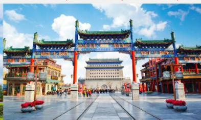
ถนนโบราณเจียนเหมิน