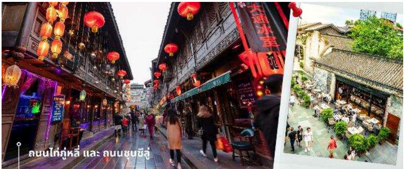
ถนนไท่กุ่หลี่ และ ถนนชุนซีลู่

จากนั้นให้ท่านให้อิสระกับการเลือกซื้อสินค้าของฝากที่ ถนนไท่กุ่หลี่ และ ถนนชุนซีลู่ ในย่านนี้เป็นถนนโบราณ ในอดีตเคยโรงงานผลิตผ้าไหมใหญ่ที่สุดในจีน ปัจจุบันได้เปลี่ยนเป็นถนนช้อปปิ้งแหล่งสวรรค์ของนักท่องเที่ยว เป็นถนนคนเดิน มีห้างสรรพสินค้าชื่อดัง มีร้านค้ามากกว่า 700 ร้านค้าที่เต็มไปด้วยสินค้าต่าง ๆ ทั้งร้านค้าแฟชั่น ร้านอาหารและโรงแรมนานาชาติมากมายซึ่งเป็นที่ยอดนิยมที่มีการเชื่อมต่อทางวัฒนธรรมท้องถิ่นที่เป็นแหล่งช้อปปิ้งและเป็นแหล่งร้านอาหารที่อร่อยต่าง ๆ มากมาย ซึ่งเป็นสถานที่เที่ยวของเฉิงตูที่ทำให้เพลิดเพลินกับสินค้าแบรนด์เนมและแบรนด์จีน เพื่อให้นักท่องเที่ยวได้เลือกซื้อตามอิสระ แะร้าน POP MART