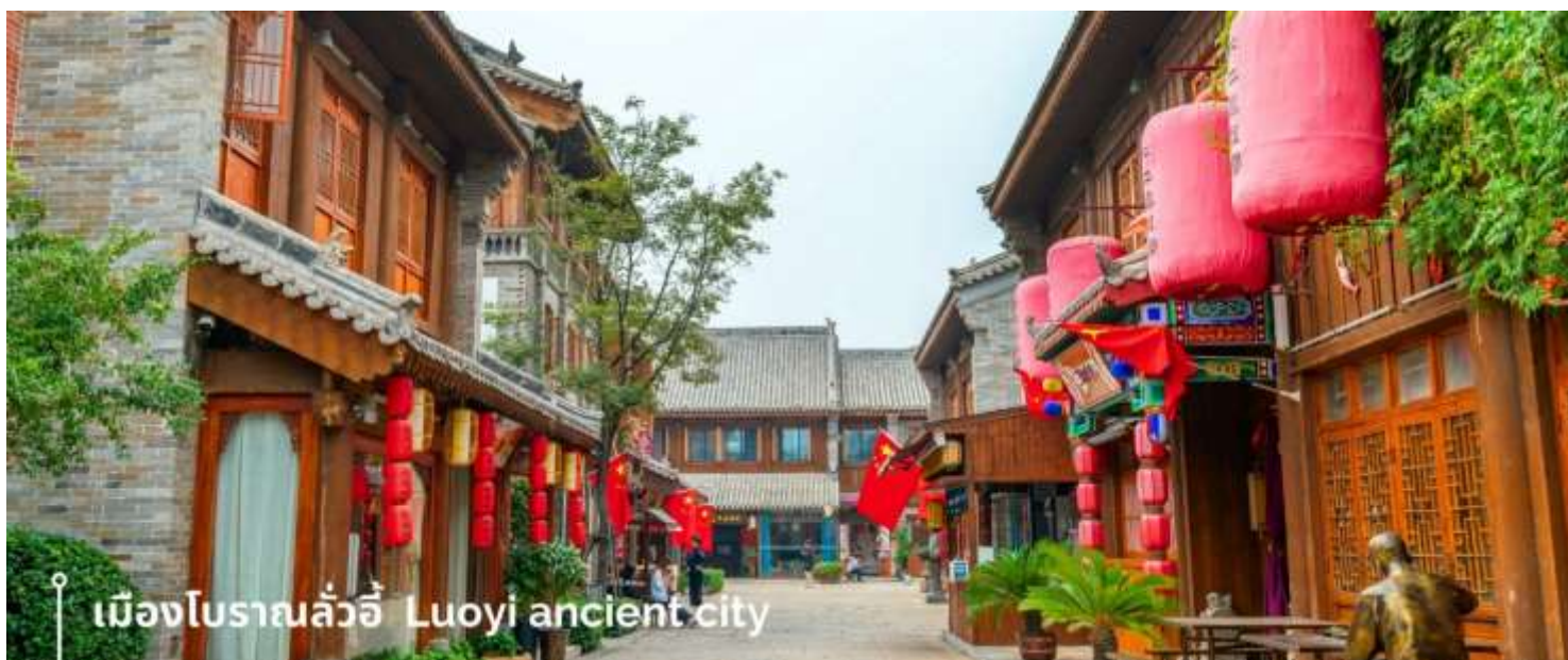
เมืองโบราณลั่วอี้ Luoyi ancient city

นำท่านเที่ยวชม เมืองโบราณลั่วอี้ เป็นสถานที่ท่องเที่ยวระดับ 1A ตั้งอยู่ในเมืองเก่าของเมืองลั่วหยาง เมืองหลวงโบราณของราชวงศ์ทั้ง 13 ราชวงศ์ บรรยากาศคอบอวลไปด้วยเสน่ห์แบบจีนโบราณ ที่ยังคงอยู่มายาวนานหลายร้อยปี เมื่อเดินเล่นผ่านเมืองโบราณลั่วอี้ จะเห็นสถาปัตยกรรมบ้านเรือน ที่มีชายคาซ้อนกันเป็นชั้นๆ และกำแพงเมือง สนามหญ้า