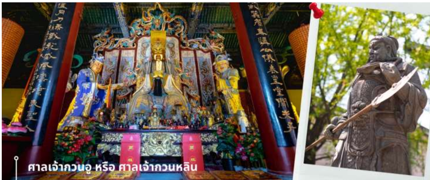
ศาลเจ้ากวนอู หรือ ศาลเจ้ากวนหลิน

นำท่านเดินทางไปยัง ศาลเจ้ากวนอู หรือ ศาลเจ้ากวนหลิน ในเมืองลั่วหยาง ตั้งอยู่ทางใต้ของเมืองลั่วหยาง มีประวัติศาสตร์กล่าวว่าที่นี่เป็นสถานที่ฝังศพของแม่ทัพกวนอู ผู้จงรักภักดีในสมัยพระเจ้าฮั่นเหียนเต๋ ก่อนถึงตำแหน่งที่ ประดิษฐานเทพเจ้ากวนอู จะมีแนวต้นไม้และสิ่งโศกหินจำนวน 104 ตัว ตั้งเรียงรายอยู่สองข้างทางเดิน พร้อมผ้าสีแดงสด เขียนคำอวยพรผูกอยู่กับตัวสิ่งโศก รวมถึงยังมีแผ่นกระดาษให้เขียนขอพรและนำไปแขวนไว้ตามกิ่งไม้