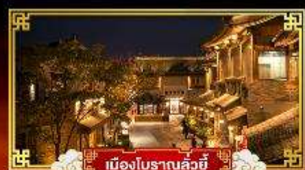
เมืองโบราณลวี้