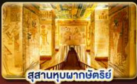
สุสานทูตหมากษัตริย์