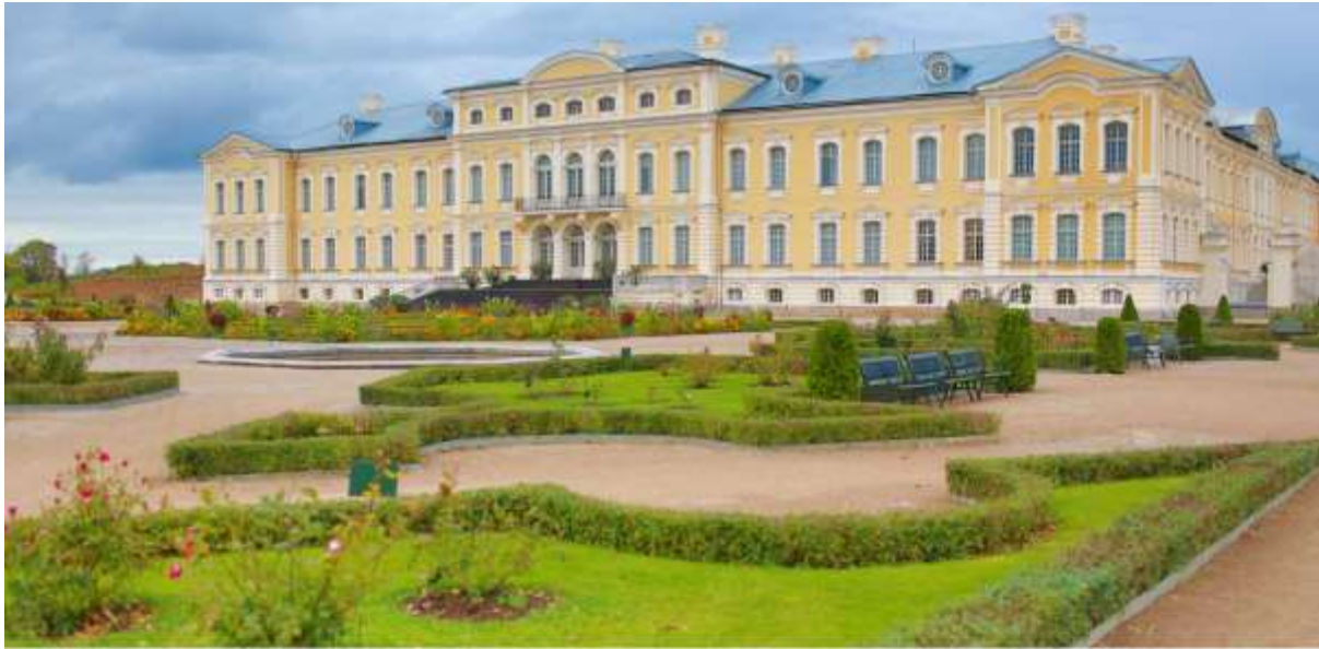
วันที่ 4 พระราชวังรูนดาล์ - เทียวชมเมืองริกา - ปราสาทริกา - House of Blackheads