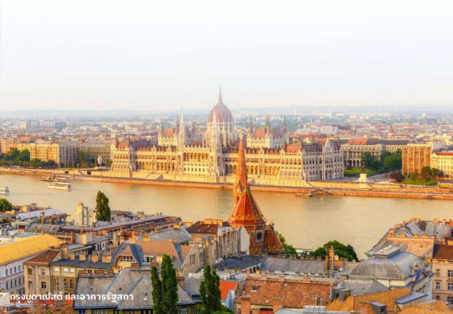
กรุงบูดาเปสต์ และอาคารรัฐสภา

นำท่านเข้าสู่ที่พัก Park Inn By Radisson Budapest หรือเทียบเท่า