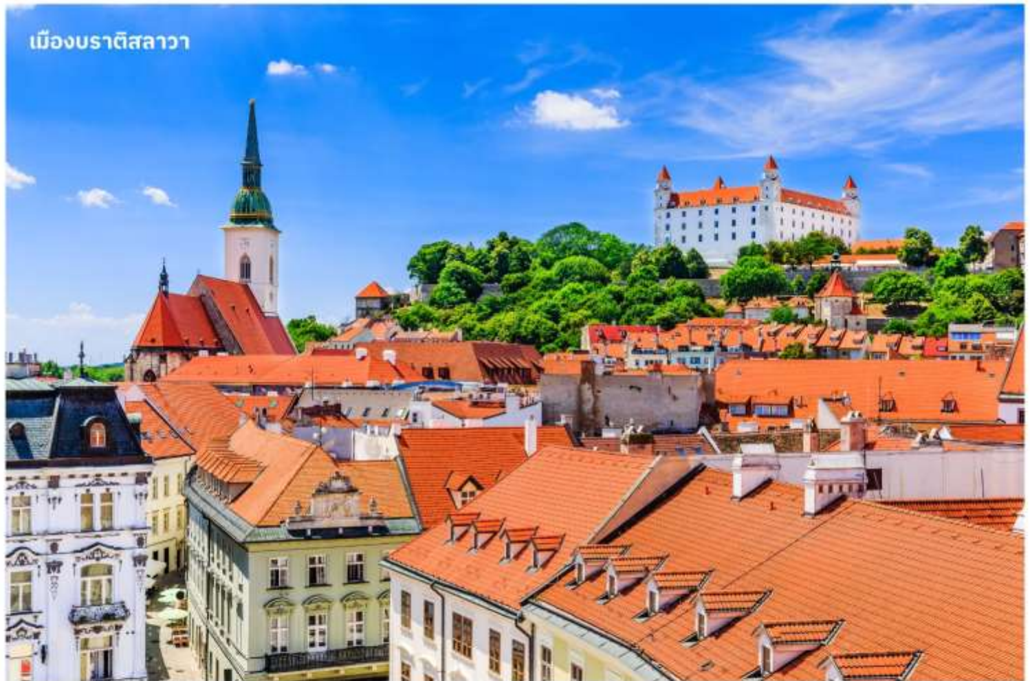
เมืองบราติสลาวา

จากนั้นนำท่านเดินทางสู่ เมืองบราติสลาวา ประเทศสโลวาเกีย ใช้เวลาเดินทางประมาณ 3 ชั่วโมง หรือมีชื่อเรียกอย่างเป็นทางการคือ สาธารณรัฐสโลวัก เป็นประเทศขนาดเล็กที่เพิ่งเข้าร่วมเป็นสมาชิกใหม่ของสหภาพยุโรป เป็นประเทศไม่มีทางออกสู่ทะเล แต่เมืองหลวงแห่งนี้เป็นเมืองที่มีชีวิตชีวาและยังเต็มไปด้วยวัฒนธรรมเก่าแก่ จากนั้นนำท่านถ่ายรูป ปราสาทบราติสลาวา ปราสาทเก่าแก่ที่ตั้งอยู่เหนือแม่น้ำดานูบ เมื่อขึ้นไปบนจุดที่ตั้งของปราสาทจะมองเห็นวิวทิวทัศน์เมืองสโลวาเกียได้ทั่วทั้งเมือง จากนั้นนำท่านเดินทางสู่ ย่านเมืองเก่าบราติสลาวา เป็นที่ตั้งของ ประตูมิคาเอล (Michael's Gate) เป็นประตูและป้อมปราการของเมืองเพียงแห่งเดียวที่ยังคงถูกเก็บรักษาไว้ตั้งแต่สมัยศตวรรษที่ 14