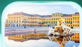
พระราชวังเซินบรุนน์