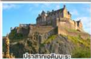
ปราสาทเอดินบะระ