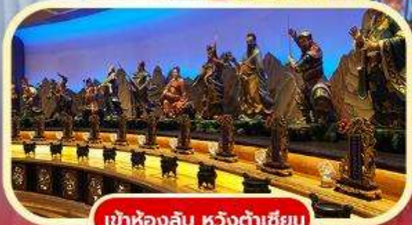
เข้าห้องลับ หวังต้าเซียน