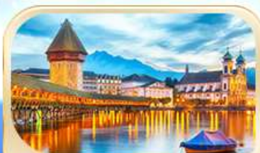
สะพานไมซ์ฮาเปล