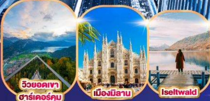
วิวยอดเขา ชาร์เตอร์คัม