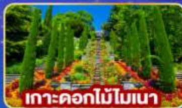
เกาะดอกไม้โมเนนา