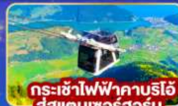
กระเช้าไฟฟ้าคานริโอ สู่สแตนเซอร์ฮอร์น