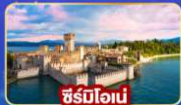
ซีร์มิโอน