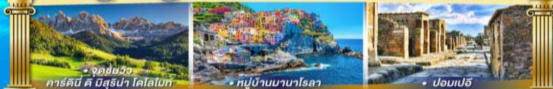
• จุดชมวิว คาร์ดินี ดี บิสสุร่า โดโลไมท์