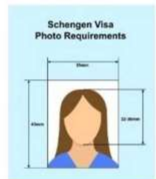
ตัวอย่างรูปถ่าย