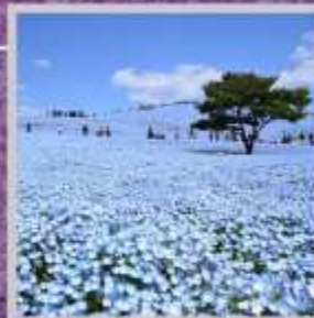
"HITACHI SEASIDE PARK"