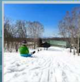
"NISEKO SKI RESORT"