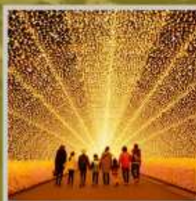
"NABANA NO SATO"