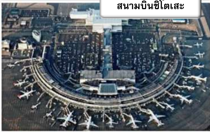
สนามบินชิตโตะเสะ

เวลา 08.20 น. เดินทางถึง สนามบินชิตโตะเสะ ประเทศญี่ปุ่น นำท่านผ่านขั้นตอนการตรวจคนเข้าเมืองและศุลกากร