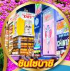
ชินโซบาช