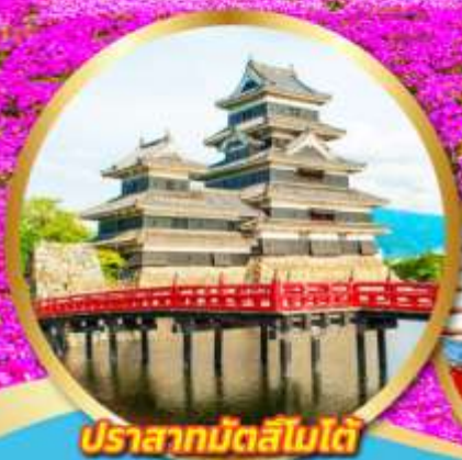
ปราสาทมัตสึโมเด