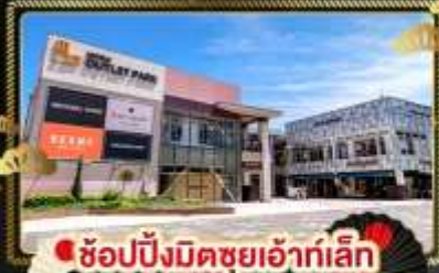
ช้อปปิ้งมิดชูยเอ้าท์เล็ท