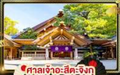
ศาลเจ้าอะสึตะจิงกู