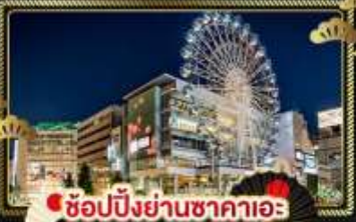
ช้อปปิ้งย่านซากาเอะ