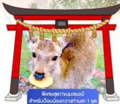
พิเศษสุด!! ชมเมฆเมเปิ้ล สำหรับบือนเมืองกวางาโน่ 1 จุด