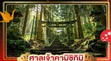
ศาลเจ้าคามิซึมิ