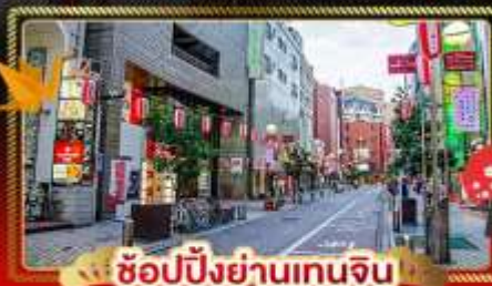
ช้อปปิ้งย่านเทนจิน