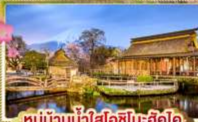
หมู่บ้านน้ำใสอิชิโนะฮัคโค

✓ สักการะ: พระใหญ่อุซึคุโคุบุตสึ ท่ามกลางซากุระ