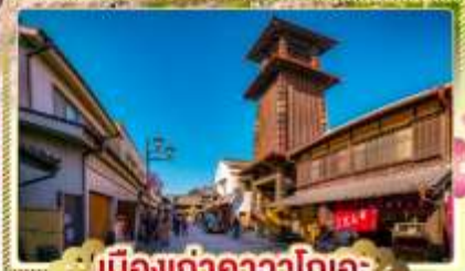
เมืองเก่าคาวาโกเอะ