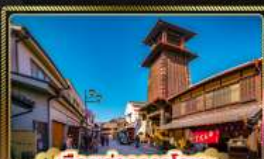
เมืองท่าคาวาโกเอะ