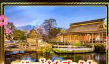
หมู่บ้านน้ำใสโอชิโนะซึกิโค