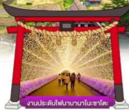
งานประดับไฟนาบานาโนะซาโตะ