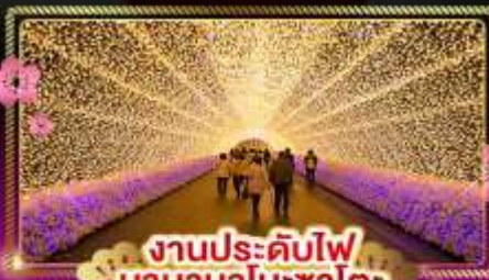
งานประดับไฟ นาคานาโนะซาโตะ