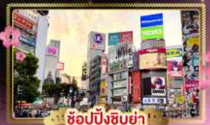
ช้อปปิ้งชิบูย่า