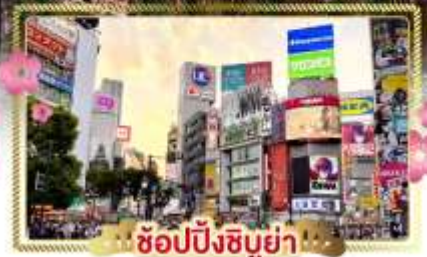
ช้อปปิ้งชิบูย่า