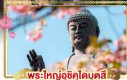
พระใหญ่อุซึคุโดบุตสึ