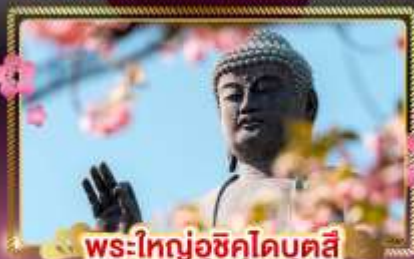
พระใหญ่อุซึคุโดบุคสี