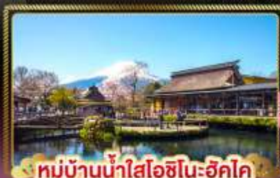
หมู่บ้านน้ำใสโอชิโนะฮักไค