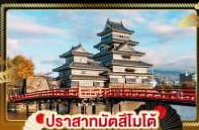
ปราสาทมัตสึโมโต้