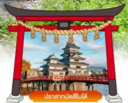
ปราสาทมัตสึโมโต้