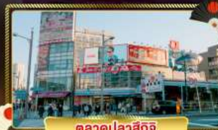
ตลาดปลาสึกิจิ