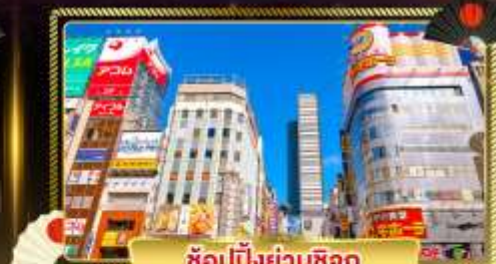
ช้อปปิ้งย่านชิจูกุ