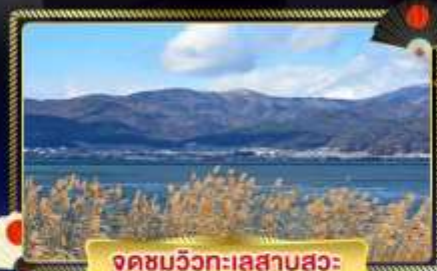
จุดชมวิวกะเลสาบสุวะ