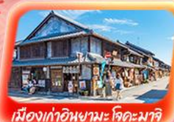
เมืองเก่าอินุยามะ คุดะมาจิ

"สัมผัสความงามของภูเขาไฟฟูจิ ขึ้นฟูจิชั้นที่ 5" จุดเช็กอินชมวิวทะเลสาบยามานากาโกะ เที่ยวย่านเมืองเก่าชิบามาตะ ขอบรรวัดดัง วัดอาซากุสะ เยือนเมืองอินุยามะ วัดโอสึคินนง ซากาอะ ศาลเจ้าฟูชิมิ อินาริ ปราสาทโอซาก้า ซุปป์ย่านชินจูกุ ชินโซบาชิ ตลาดปลาแห่งใหม่ โทโยสุ "