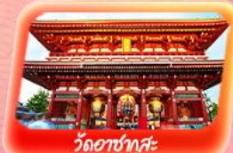
วัดอาซากุสะ