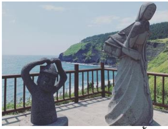
เห็นการดำทะเลของบ้างบริเวณนั้นด้วย

และได้ลองชิมสัมผัสดๆ จากต้น จากสวน ถือเป็นอีกกิจกรรมยอดฮิต เมื่อมาเยือนเกาะเชจู ช่วงฤดูกาลสัมผัสนี้เดียว 1ปีมี1ครั้ง คือช่วงหน้าหนาวเท่านั้น