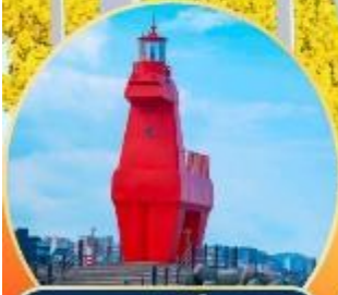
ชมทิวทัศน์ไฮเนเกอู