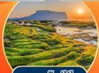
หาดคังซึงกี